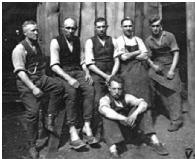
Maj 1940 r. Obóz w Ostródzie w b. Prusach Wschodnich