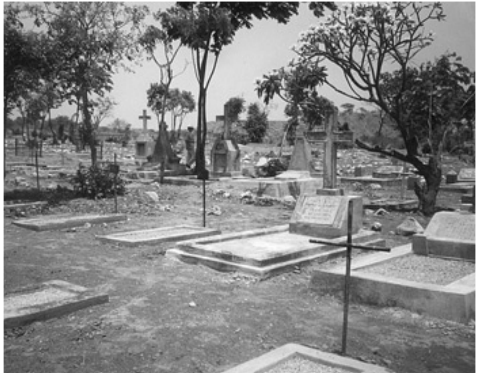
Bwana M'Kubwa 1998 r. Cmentarz polski z lat 40.