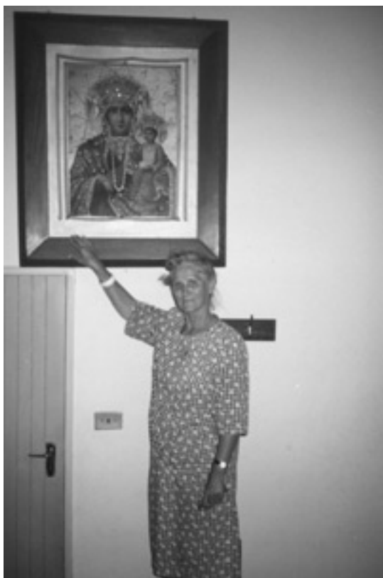
N'Dola, październik 1998 r. Obraz Matki Boskiej Częstochowskiej z kościoła w Bwana M'Kubwa (1945–1948). Obecnie znajduje się w N'Doli u oo. Franciszkanów