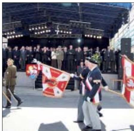
Kombatanckie poczty sztandarowe przemarszerowały przed trybuną honorową