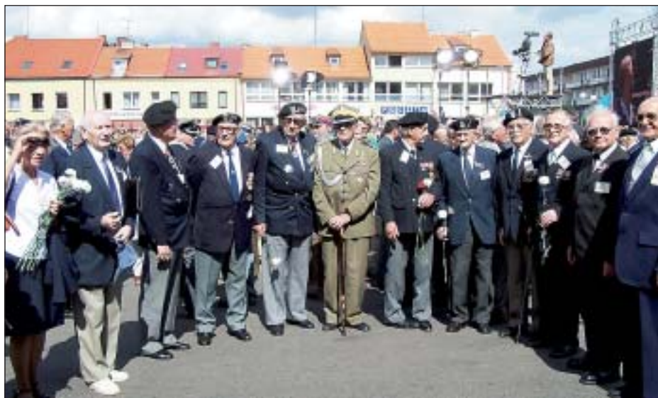
Kombatanci na rynku w Wieluniu

Na uroczystości do Wielunia przybyły liczne delegacje środowisk kombatanczkich – malowniczy wieluński rynek wypełnił się zielenią mundurów i barwami pocztów sztandarowych, zaś na trybunie honorowej zasiedli obok Prezydenta RP Aleksandra Kwaśniewskiego przedstawiciele władz państwowych i samorządowych, parlamentarzyści, przedstawiciele Instytutu Pamięci Narodowej, delegacje z innych miast polskich, czeskich i niemieckich. Urząd do Spraw Kombatantów