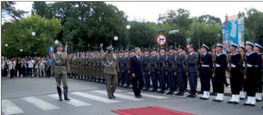
Prezydent Aleksander Kwaśniewski przed kompanią reprezentacyjną Wojska Polskiego