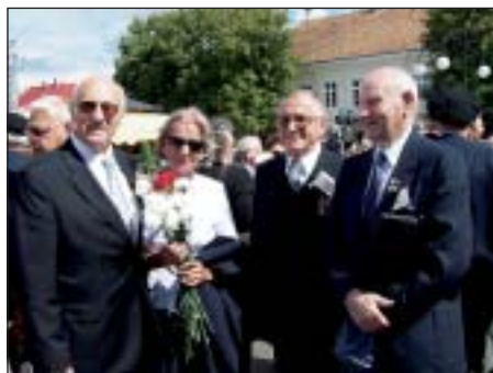
Minister Jan Turski (pierwszy z lewej) z kombatantami po oficjalnej części uroczystości