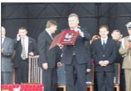
Prezydent Aleksander Kwaśniewski z rzygrafem przedstawiającym orla z Cmentarza Polskiego na Monte Cassino, który otrzymał od Stowarzyszenia Byłych Żołnierzy Polskich Sił Zbrojnych na Zachodzie „Karpaczycy”

laną krew. Kląnam się nisko prochom Waszych współtowarzyszy, którzy na ołtarzu Ojczyzny złożyli największą ofiarę – własne życie. Przywołuję pamięć o tysiącach polskich oficerów i żołnierzy zamordowanych w Katyniu, Miednoje i Charkowie; zamęczonych w drodze na daleką, nieludzką ziemię – na rozległe syberyjskie bezdroża i w gorące stepy Kazachstanu. Słowa ogromnego szacunku kieruję do wszystkich tych, których nie złamał terror okupantów, którzy przetrwali jenieckie i koncentracyjne obozy, wywózki do przymusowej pracy, deportacje. Jestem bardzo rad, że w dzisiejszej uroczystości ramię w ramię uczestniczą przedstawiciele najważniejszych związków i stowarzyszeń weteranów drugiej wojny światowej. Jest rzecz, która nas wszystkich łączy: umiłowanie Ojczyzny. (...)