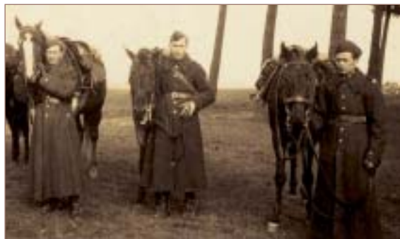
Wrzesień 1939. Zwiad. Od lewej autor wspomnień

Po opanowaniu miasta dywizja, przy wsparciu artylerii, opanowała silnie bronioną przez Niemców miejscowość Góra Świętej Małgorzaty i kilka innych osad. W czasie tych