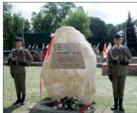
Obelisk upamiętniający ofiary nalotu Luftwaffe na Wieluń