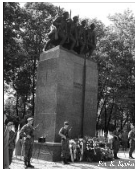
Warta honorowa przed Pomnikiem Legionów Polskich