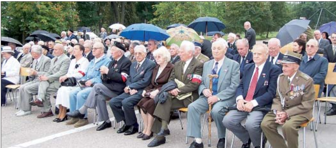
Mimo nie najlepszej pogody, do Zegrza zjechała liczna grupa gości ze wszystkich środowisk kombatanckich